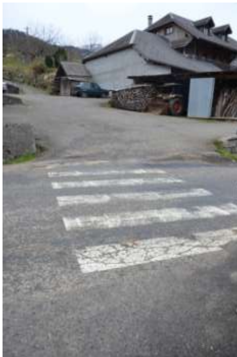
Photo 2 : Réfection marquage du passage piéton au niveau de chez Mr BOUVIER Aimé