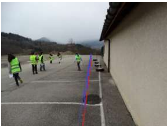
Photo 11 : Lorsque les enfants sortent de l'école, ils n'empruntent pas le « passage » entre le mur du préau et le parking car pas assez large, en conséquence ils empruntent la chaussée. Risque de heurt des enfants pas les véhicules qui