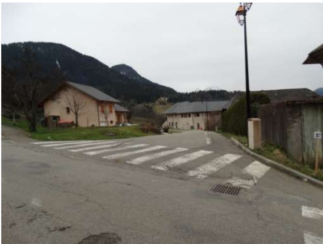
Photo 6 : Réfection des marquages au sol des deux passages piétons. Les enfants signalent que la partie piétonne entre ce carrefour et l'école est souvent « squattée » par des véhicules stationnés.