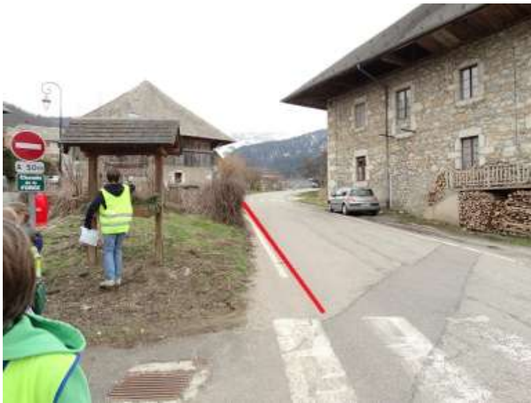
Photo 10 : réaliser un nouveau marquage permettant d'avoir suffisamment de place entre la clôture et la chaussée