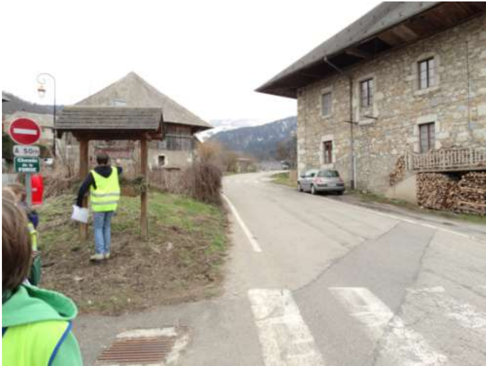
Photo 5 : Réfection du marquage du passage piéton entre Le chemin de la Forge et la D61. A noter les difficultés de cheminement pour accéder vers l'école, soit par des véhicules garés le long de chez madeleine, soit par manque de place sur la gauche du fait d'une part de la végétation et d'autre part par un manque de place entre clôture et bande blanche chaussée.