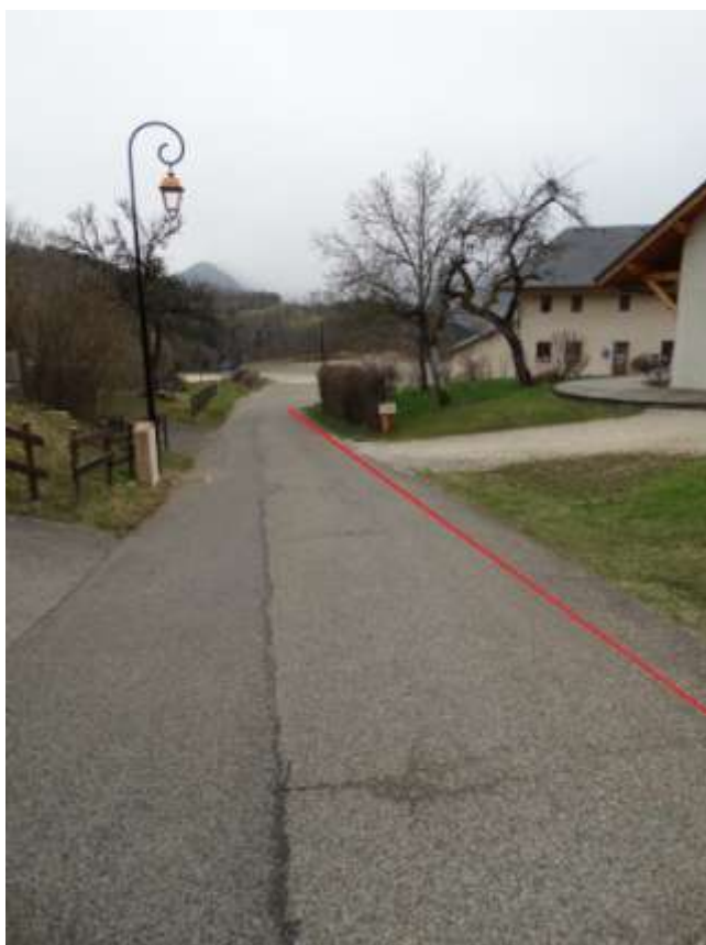
Photo 13 : Créer un traçage au sol, afin de délimiter une zone piéton et chaussée dans la montée de l'école