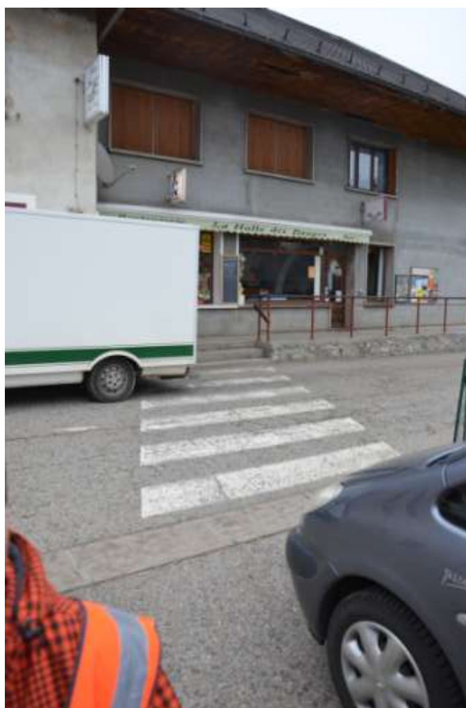
Photo 4 : Réfection du marquage du passage piéton au niveau de la Halte. Deux autres passages piétons situés plus loin sont également à repeindre.