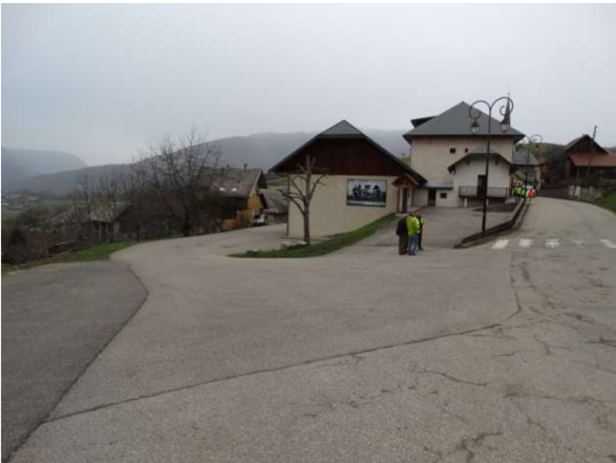
Photo 15 : a quoi sert ce passage piéton ?, d'un coté un muret, de l'autre un champ

Vitesse : Les enfants constatent une vitesse excessive, notamment au niveau de l'école sur la D61, proposition : mettre des ralentisseurs, mettre des panneaux de vitesse 30 Km/h, déplacer les