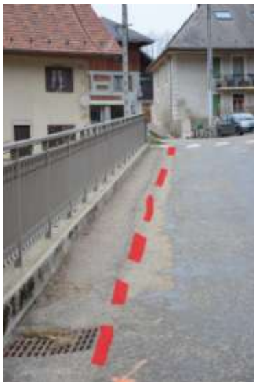
Photo 8 : Entre la maison de Chez Mr MARI et l'ex mairie, il faudrait prévoir à minima une ligne blanche (repérée par des pointillées rouge sur la photo) permettant aux piétons de circuler plus en sécurité. Deuxième solution, implanter un système de plots ou barrières pour mieux délimiter la chaussée. Troisième solution, réaliser une passerelle en encorbellement au dessus du mur pour pouvoir déplacer la rambarde et créer un réel chemin piéton.