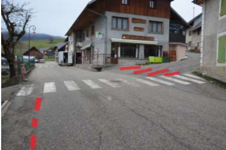
Photo 9 : dans la continuité de la photo précédente, continuer le traçage au sol et création d'un passage piéton (Cf. photo 3)