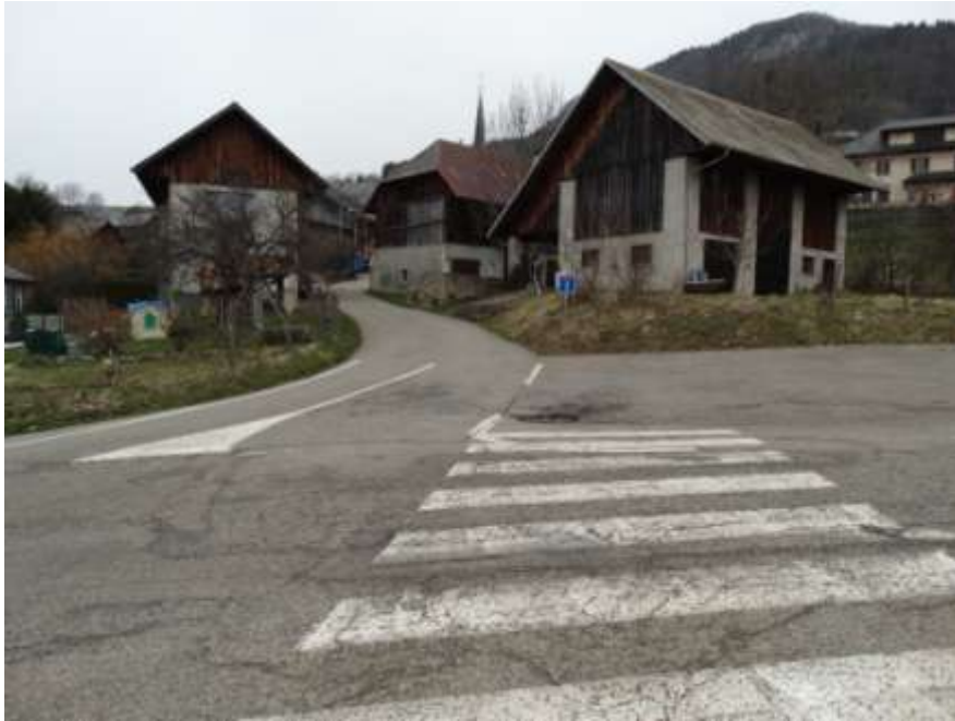
Photo 7 : A ce carrefour, il existe deux passages piétons nécessitant d'être remis en peinture (celui de gauche n'est pas pris sur la photo. Toutefois, il faut se poser la question si ces deux passages piétons doivent cohabiter. Le cheminement qui avait été déterminé par la commune était en utilisant le passage non représenté sur cette photo... Si celui représenté sur la photo doit rester, il doit être prolongé jusqu'au chemin qui monte de l'école.