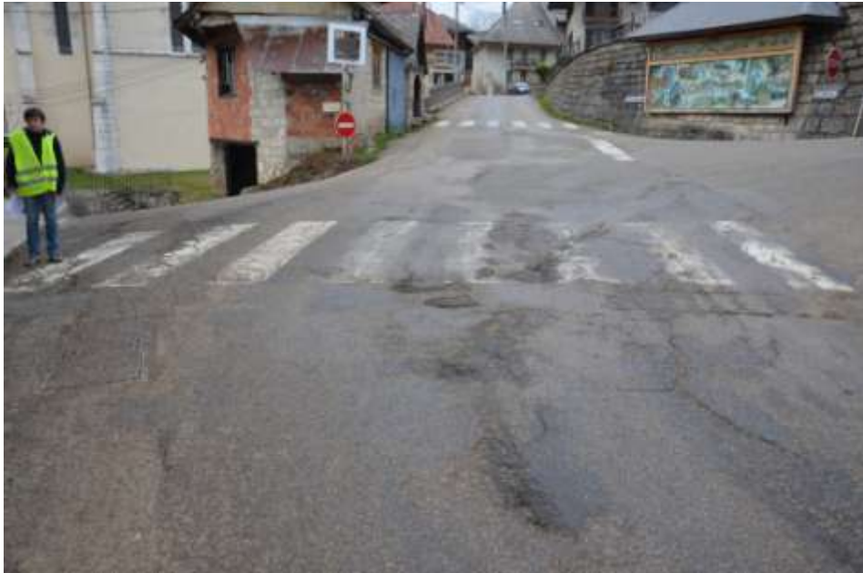
Photo 1 : réfection marquage au sol au carrefour Chef lieu Bellecombe et Les Monts, Réfection également de la ligne STOP. A noter le passage piéton qui va de l'ancien four du Chef Lieu et arrive au niveau du mur. (A voir s'il est nécessaire de le garder ?)