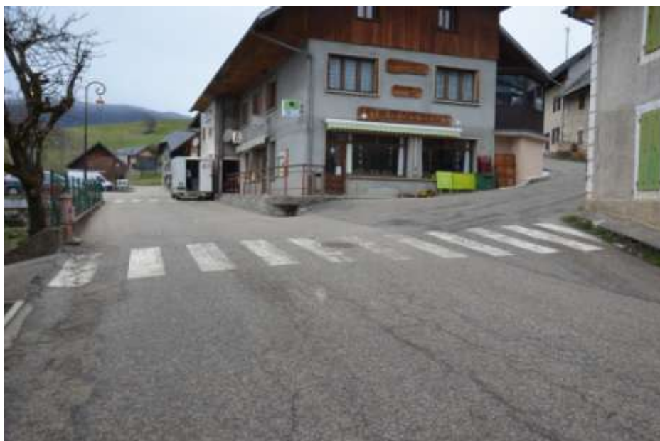
Photo 3 : Réfection du marquage du passage piéton au de la maison JL Garcette. A noter le manque de passage piéton pour traverser vers la Halte en continuité de celui-ci.