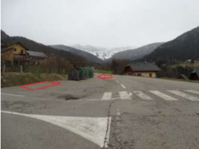
Photo 14 : Les enfants indiquent qu'ils n'ont pas la visibilité vers le haut du carrefour, effectivement, ils doivent être à environ 1/3 du passage piéton pour voir arriver les véhicules, ils se plaignent également de la vitesse excessive. Proposition 1 : déplacer les containers de poubelle vers le bas ; proposition 2 : enterrer les poubelles comme dans les grandes villes ; proposition 3 : déplacer les containers vers un autre site.